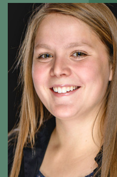
Catherine Le Gall Marchand Conception éclairages