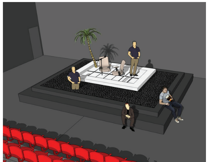
Maquette virtuelle du décor

Après avoir vu le spectacle, nous sommes en mesure d'affirmer que cette image représente l'inaction d'un certain groupe de personnes face aux changements climatiques.